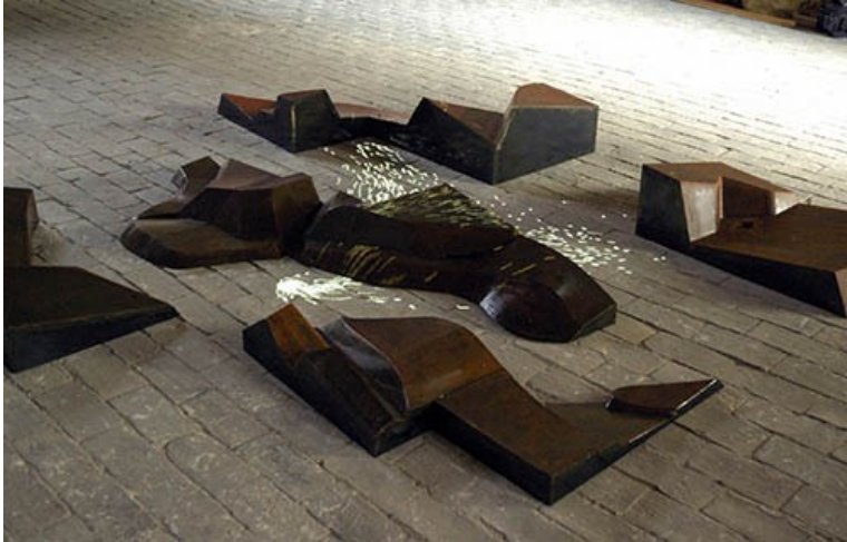
Patrice Belin, Antoine Schmitt , 3,2m x 2,4m x 2m, 2011, œuvre spécifique programmée sur ordinateur projetée sur des sculptures en acier, pièce unique, Courtesy Patrice Belin.