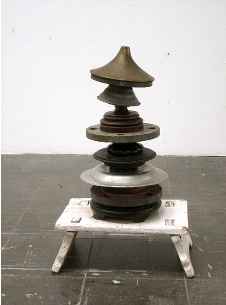
Brigitte Stahl, Untitled , 2012, wood, varnish, métal and rubber, 58 x 37 x 22 cm, photo crédit : Brigitte Stahl, Stuttgart, courtesy Galerie Michael Sturm