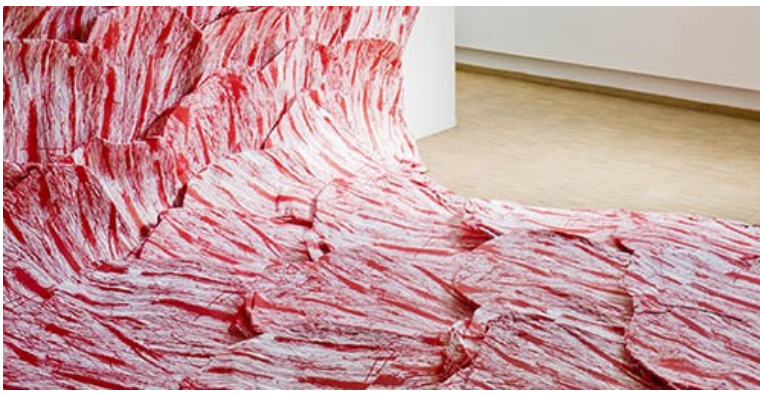
Roby Comblain, SCENOLINO , installation (format variable)