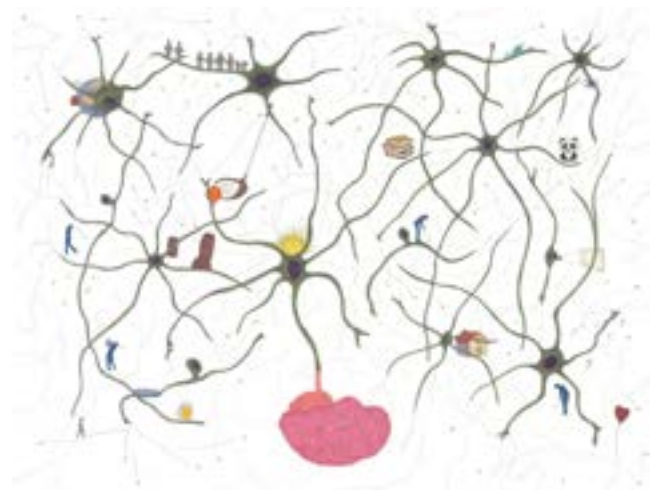
In my brain , 2018 Encre sur papier 32 x 40cm, encadrée / Ink on paper , 32 x 40cm, framed

'I will sleep when I'm dead' is a dive into the brain, a navigation by sight amongst neurons and synapses. The visitor gets lost in an infinite maze and crosses paths with « thoughts » materialized by 2D and 3D drawings. An intimate head to head, closely psychoanalytical, that introduces to an intense and a unique experience.