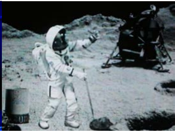
"Pierrick on the Moon (mission 2)", 2019

Dispositif optique et projection, dimensions variables / Optical device and projection, variable dimensions