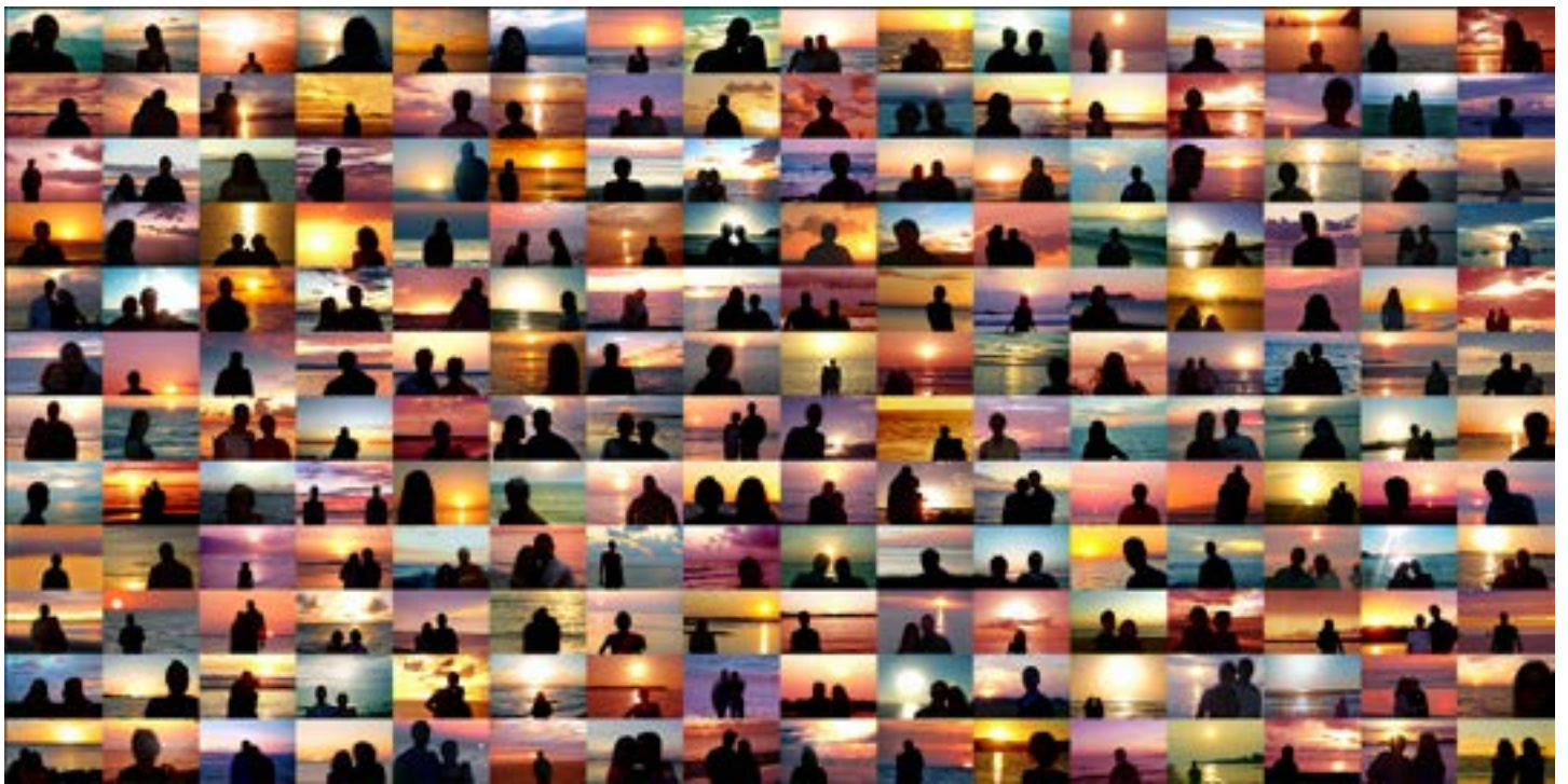
Sunset Portraits from 49,225,237 Sunset Pictures on 03/29/2022 , 2022 Machine c-prints, each 10 x 15cm / 2000 tirages c-print, chacun 10 x 15cm, 200 x 150cm total

Les images de «Sunset Portraits from Sunset Pictures on Flickr» proviennent de la même source que celles de «Suns from Sunsets from Flickr». Pour Sunset Portraits, Umbrico a trouvé des images où la technologie de l'appareil photo expose le soleil, et non les personnes qui se trouvent devant, effaçant ainsi la subjectivité de l'individu. Elle utilise l'ensemble de la photographie pour ce travail, en pensant à la relation entre le collectif et l'individuel, à l'affirmation individuelle de «je suis là» dans le processus de prise de vue, et au manque d'individualité qui est finalement exprimé, et vécu, face à tant d'affirmations qui sont plus ou moins toutes les mêmes.