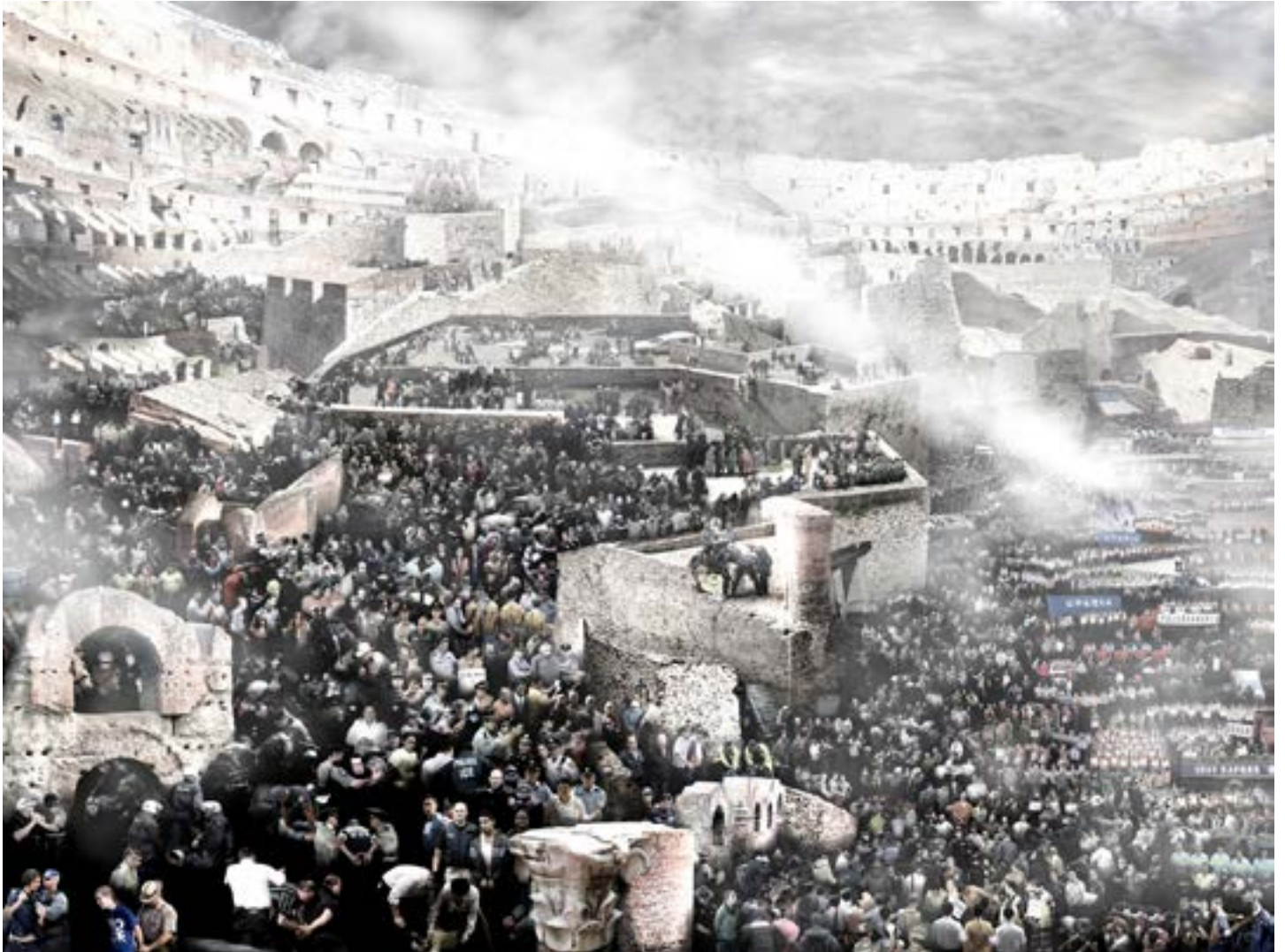
Colosseum-Global arrestation, 2016

Tirage, édition de 6 / Print on paper, edition of 6, 120 x 160cm