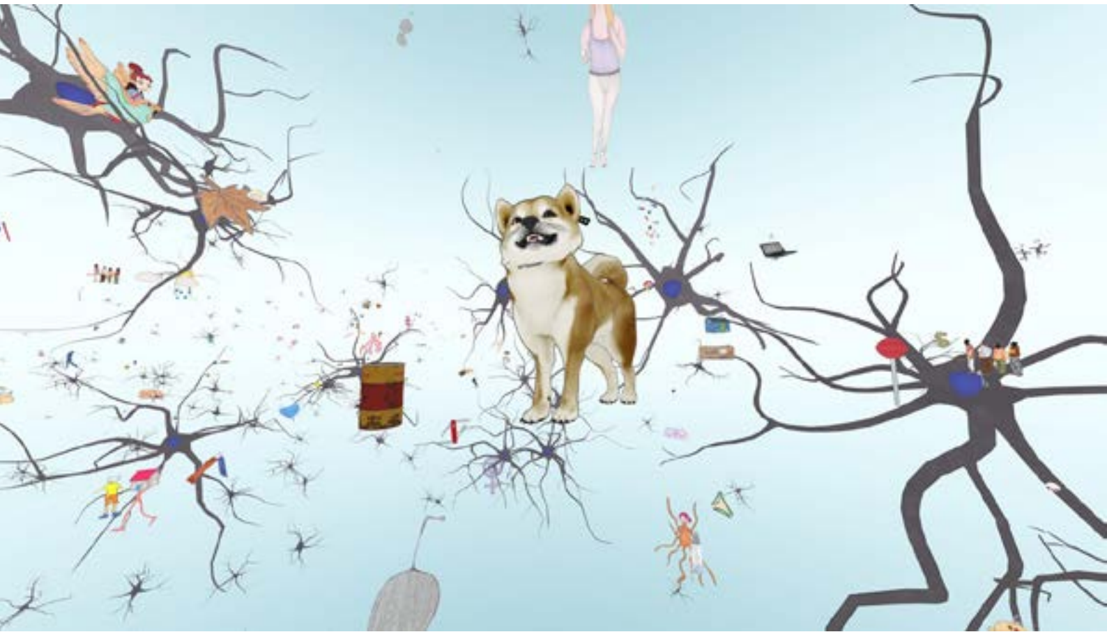
I will sleep when I'm dead , 2020 Réalité virtuelle / virtual reality , 6mn40 Regarder / Watch here

« I will sleep when I'm dead » est une plongée dans le cerveau, une navigation parmi les neurones et synapses. Le visiteur se perd dans un labyrinthe infini et croise des « pensées » matérialisées par des dessins 2D et 3D. Un face à face intime, quasi psychanalytique, qui introduit une intensité et une expérience unique.