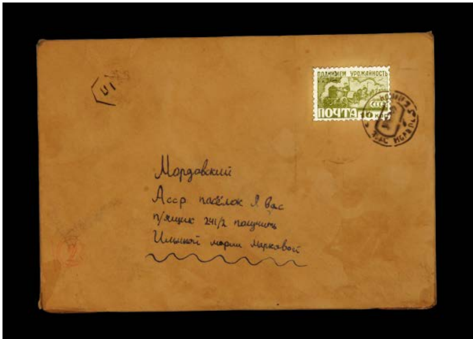
Lettres perdues / Lost letters, obets vidéo / video objects, Enveloppe, écran, batteries / envelop, screen, battery, 50 x 30 cm, 2011

2009 Soutien Scam et Arcadi pour la création de Memo, installation interactive à partir d'anciens timbres postaux.