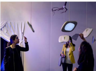
Masha Margolis, The root, 2012. Show Off 2013.

A lire, l'enquête de Veronique Gode sur la FIAC 2013 et les foires d'art contemporain.