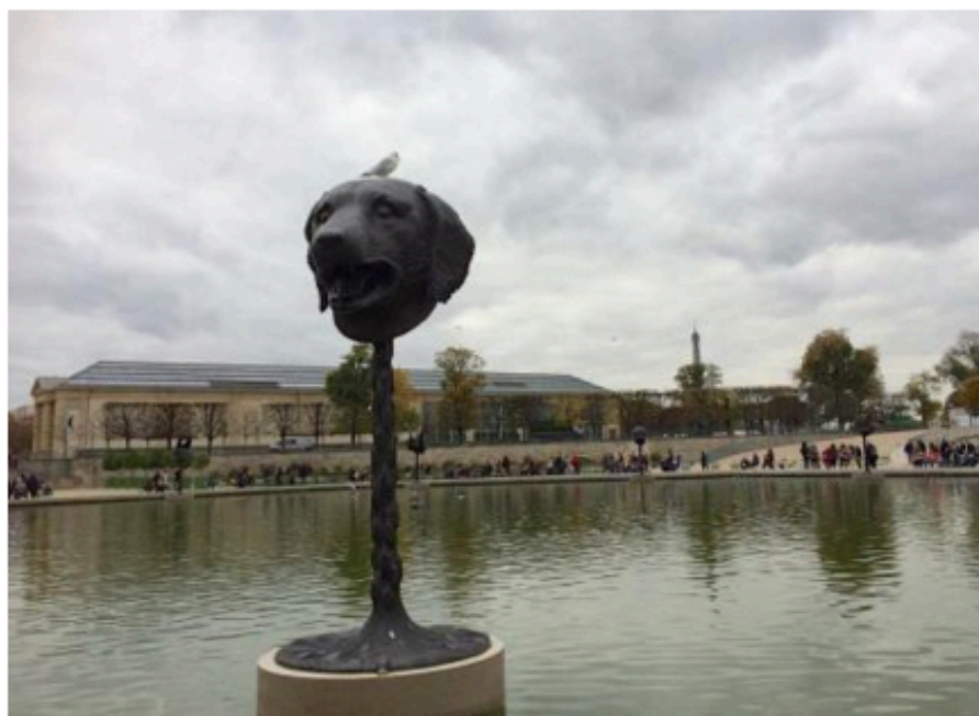
Circle of Animals / Zodiac Heads (détail), Jardin des Tuileries Ai Weiwei, 2010.

La carte du grand rendez-vous parisien automnal de l'art contemporain s'est considérablement élargie cette année. Du fait, notamment, de la volonté de la Fiac d'associer à son parcours Hors les Murs un certain nombre de musées et institutions, qui balisent pour la plupart les bords de Seine entre le Grand Palais et la Cité de la mode et du design où se tient l'évènement connexe, Officielle. D'autres foires comme Art Ellysées, Slick, Outsider, YIA, Variation ou encore Salon Zürcher complètent un programme déjà gargantuesque. Que l'on travaille ou pas, dans l'univers de l'art ou non, il s'agit d'une édition de la Fiac ou, pour être plus précis, une semaine de l'art contemporain sélective et à la carte.