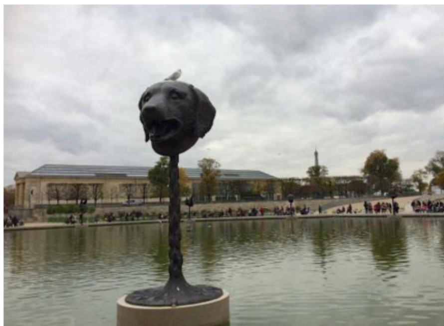
Circle of Animals / Zodiac Heads (détail), Jardin des Tuileries Ai Weiwei, 2010.

La carte du grand rendez-vous parisien automnal de l'art contemporain s'est considérablement élargie cette année. Du fait, notamment, de la volonté de la Fiac d'associer à son parcours Hors les Murs un certain nombre de musées et institutions, qui balisent pour la plupart les bords de Seine entre le Grand Palais et la Cité de la mode et du design où se tient l'évènement connexe, Officielle. D'autres foires comme Art Ellysées, Slick, Outsider, YIA, Variation ou encore Salon Zürcher complètent un programme déjà gargantuesque. Que l'on travaille ou pas, dans l'univers de l'art ou non, il s'agit d'une édition de la Fiac ou, pour être plus précis, une semaine de l'art contemporain sélective et à la carte.