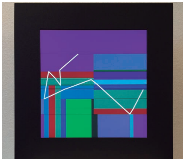
Manfred Mohr, P1622-C , (2013). Obra generativa | generative work.

VP: La mayoría comienzan con los formatos tradicionales, y es solo cuando descubren el videoarte y el arte digital que empiezan a apreciar y a adquirir formas artísticas más ambiciosas. Hemos ayudado a muchos en su primera compra de una obra de arte generativo o de vídeo,