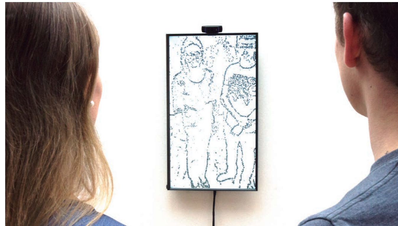
Manfred Mohr, P1622-C . Obra generativa | generative work (2013). Cortesía | courtesy of Galerie Charlot.

PW: Are collectors more interested in "traditional" formats (painting, sculpture, drawing) or are they attracted by new media? Have you noticed a particular interest for new media among a younger audience or collectors?