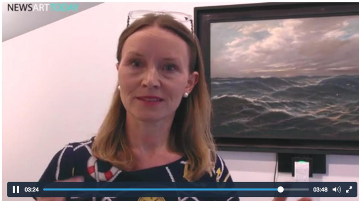
G Mignonneau & Sommerer - Value of art .mp4 par NewsArtToday

Le nu dans l'art Contemporain vu par plus de 160 artistes