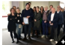
ET LE LAUREAT DU PRIX ARTE / BEAUX-ARTS MAGAZINE EST...