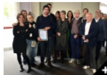
ET LE LAUREAT DU PRIX ARTE / BEAUX-ARTS MAGAZINE EST...