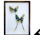
SLICK AU BON MARCHÉ RIVE GAUCHE