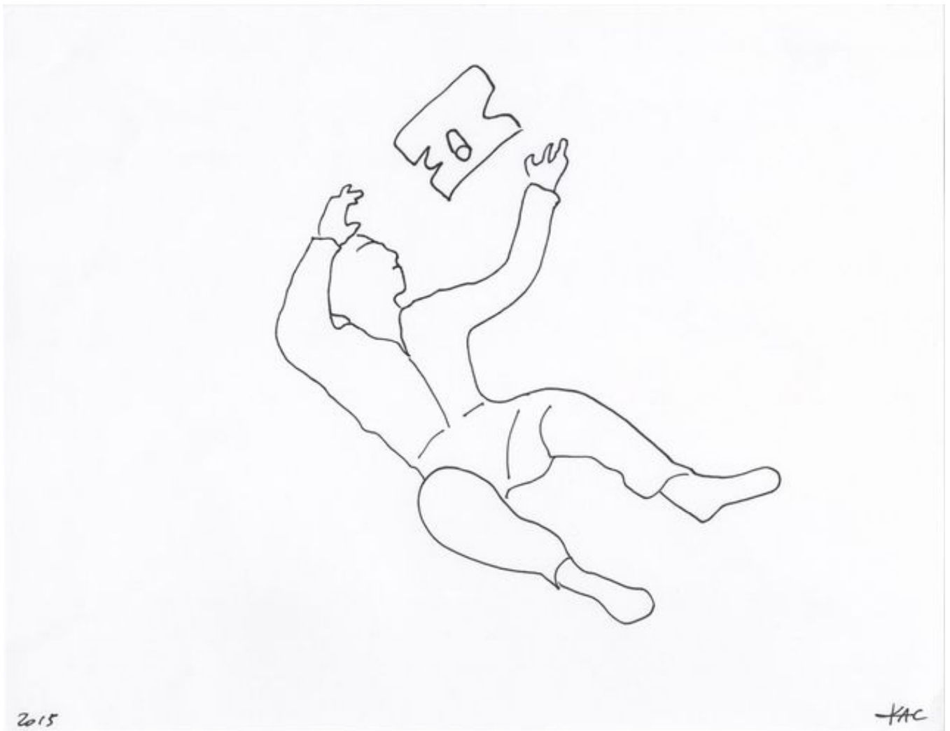
Dessin - le télescope intérieur © Eduardo Kac

L'astronaute français vient d'accomplir une performance de poésie spatiale au beau milieu de l'ISS. C'est la première création artistique née dans l'espace.