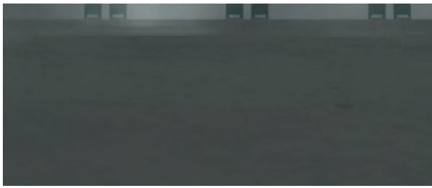
Thibault Brunet: série Vice city. 2012. Tirage encre pigmentaire . 20cm x 20.

En face, la galerie des Petits carreaux expose des photos d'Yves Trémorin où le corps devient paysage. La galerie Backslash, une habituée de la Slick, présente une belle verticale composée de plâtre, bois, verre et mousse de Boris Tellegen.