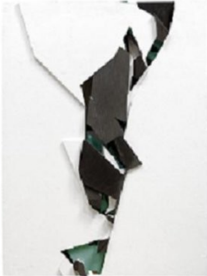
Boris Tellegen: Undersurface 1. 135cm x 102 x 8. Plâtre, bois, verre, mousse.

En face, la galerie des Petits carreaux expose des photos d'Yves Trémorin où le corps devient paysage. La galerie Backslash, une habituée de la Slick, présente une belle verticale composée de plâtre, bois, verre et mousse de Boris Tellegen.