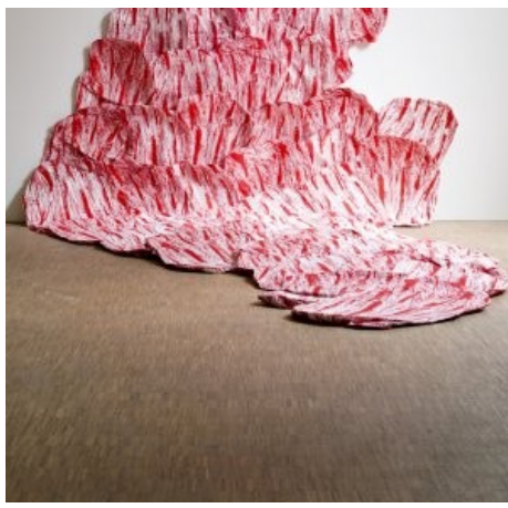
Roby Comblain: Scenolino. 2011. Installation. © Courtesy Anversville Contemporary Antiquary.

Un peu plus loin sur le stand de la galerie allemande Van der Grinten, j'observe cette photo dont je ne saurais dire si elle est angoissante ou reposante. Une femme allongée comme un oiseau tombé du ciel .