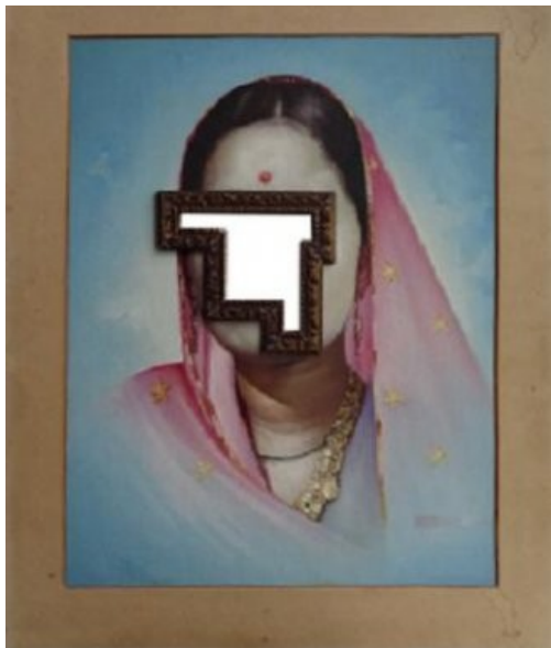
Nandan Ghiya: Sans titre (Facebook series), 2012. 66cm x 56. © Courtesy Nandan Ghiya / Galerie Paris-Beijing.

Encore une Slick réussie. Si vous voulez voir les galeries émergentes qui ne cèdent pas à la provocation facile, si voulez découvrir des artistes qui ont leur univers... c'est là que ça se passe.