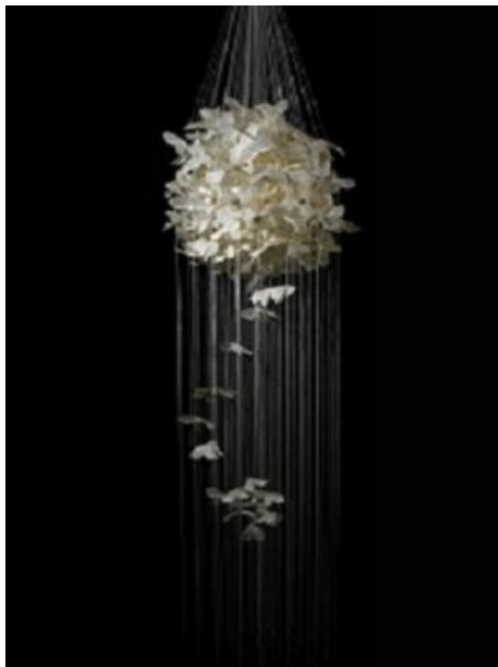
Tsuyu: Mesdames Butterflies III. 2011. 2,50cm x 0,50. papier en fibre de mûrier, fil de nylon.

De la douceur encore avec cette installation très poétique en fibres de murier de Tsuyu : un joli moment de poésie.